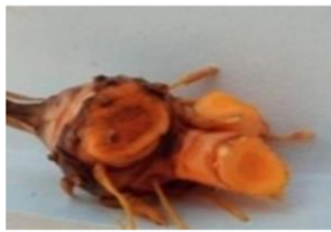
Gambar 2.2 Rimpang temulawak (Mukti & Utamy, 2020).