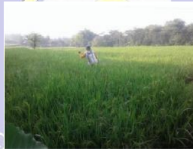
Gambar 2.1 Petani yang sedang menyemprot pestisida (Sudarsono et al. , 2022).

Pestisida adalah suatu zat kimia yang digunakan untuk membunuh hama atau pest , meliputi insekta, jamur, tikus, mites, dan larva serangga. Penggunaan pestisida di bidang pertanian telah digunakan secara luas untuk meningkatkan produksi pertanian, perkebunan, dan memberantas vektor penyakit. Penggunaan pestisida terutama sintetik sangat dibutuhkan dalam rangka meningkatkan produksi pangan untuk menunjang kebutuhan yang semakin meningkat, tetapi