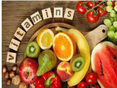
Gambar 2. 6 makanan yang terdapat vitamin

dipenuhi bermula dari jumlahnya suplemen yang diperlukan. adalah zat organik kompleks yang diperlukan.