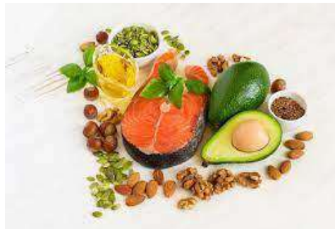
Gambar 3 : makanan yang terdapat lemak

Balita membutuhkan lebih banyak lemak mulaidariorang dewasa dkarenakan mereka dengan lebih banyak energi hingga masa perkembangan dan perkembangan, lalu lemak juga berfungsi sebagai zat terlarut dalam nutrisi A, D, E dan K yang hanya adalah pelarut lemak.