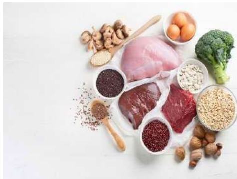
Gambar 2. 7 makanan yang terdapat zat besi

Kanak-kanak kecil sangat membutuhkan zat besi, terutama dalam membantu mengembangkan otak mereka. Jika keperluan besi anda tidak dipenuhi, bagaimanapun, anda akan mendapati prestasi otak anda semakin berkurangan. Varieti makanan yang mengandungi asid L-askorbik merupakan salah satu sumber makanan yang berguna dalam pengekalan zat besi.