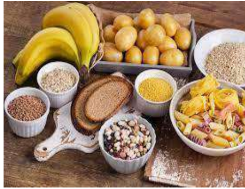
Gambar 2. 4 makanan yang terdapat karbohidrat