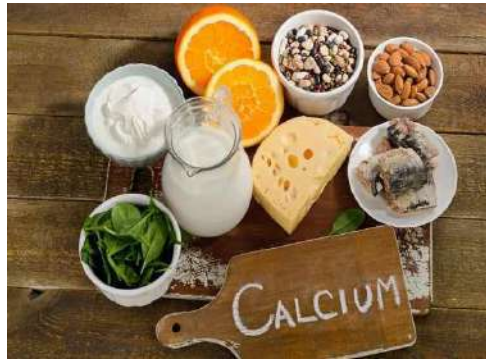
Gambar 4 : makanan yang terdapat kalsium

tulang lalu anak kecil melalui perkembangan yang dinamis dapat menghinmulai patah tulang. Kebutuhan kalsium daribayi sekitar 500-650 mg/hari. Kalsium bisa didapat mulai susu, cheddar, kacang-kacangan dan salmon.