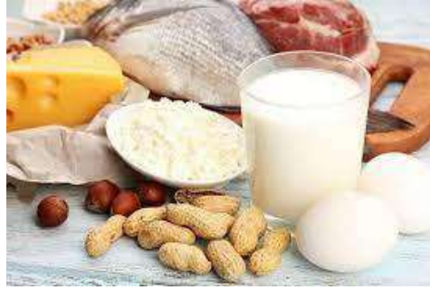
Gambar 2. 3 makanan yang terdapat protein