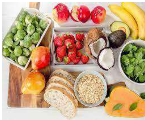
Gambar 2. 5 makanan yang terdapat serat

Serat adalah termasuk mulai gula dan protein nabati yang tidak dipisahkan dalam sistem pencernaan kecil dan bermanfaat dalam menghalangi penyumbatan. Serat akan mengakibatkan perut terasa cepat kenyang tanpa henti, lalu akan mengakibatkan berbagai jenis makanan.