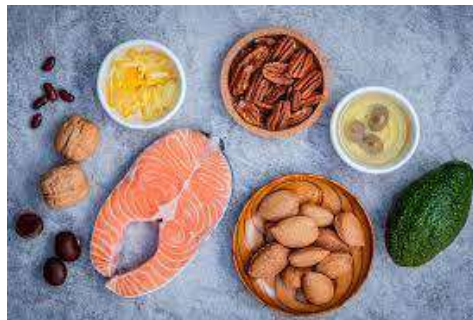
Gambar 2. 2 makanan yang terdapat kalori

Balita membutuhkan sumber kalori sekitar 1500 kalori/hari dikarenakan anak kecil sangat dinamis lalu membutuhkan jumlah kalori yang pas. Kalori bisa didapat mulai sumber makanan yang terdapat protein, lemak dan gula.