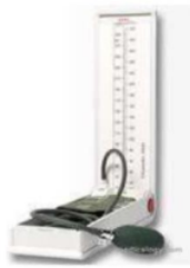
Gambar 2.1 : sphygmomanometer air raksa

tiup yang terkait dengan silinder panjang yang diisi dengan merkuri. Estimasi pulsa ditampilkan pada silinder dalam milimeter air raksa (mmHg) dan bergerak ke atas untuk menyedot siphon. Untuk perkiraan, spesialis meletakkan instrumen di lingkaran lengan dan stetoskop di lengan atas pasien. Hubungkan stetoskop ke rute suplai di bawah selongsong.