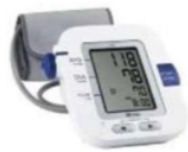
Gambar 2.3 : Sphygmomanometer elektronik

dan konverter. Informasi nilai yang didapat dari sensor diteruskan oleh chip ke estimasi regangan sirkulasi.