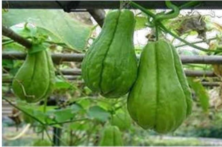
Gambar 1.1 labu siam ( sechium edule )