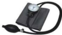
Gambar 2.2 : Sphygmomanometer aneroid