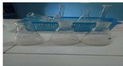
Gambar 4. Hasil Titrasi Iodometri

Pada gambar 3 ini menunjukkan bahwa tiga Erlenmeyer yang berisi ekstrak singkong rebus 15, 20 dan 25 menit, ditambahkan larutan luff berwarna biru tersebut dipanaskan di atas hotplate sampai mendidih, setelah itu di dinginkan.