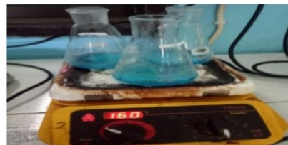
Gambar 3. Proses Pemanasan

Pada gambar 2 ini menunjukkan bahwa didalam Erlenmeyer tersebut terdapat larutan ekstrak dan larutan luff yang sudah tercapampur rata berwarna biru sebelum dilakukan pemanasan.