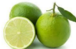
Gambar 1. Buah Jeruk Nipis (Sarwono, 2001)

lapisan pada buah jeruk nipis: a. Lapisan luar yang memiliki banyak kandungan kelenjar minyak atsiri, bertekstur keras, memiliki warna hijau muda ketika masih muda, namun jika sudah matang akan berubah warna kekuningan disebut juga dengan flavedo . b. Lapisan pertengahan memiliki sifat menyerupai spons, disebut juga dengan albendo . c. lapisan terdalam memiliki sekat-sekat, yang membentuk ruang-ruang serta adanya gelembung yang mengandung air, didalamnya berisi biji-bijian.