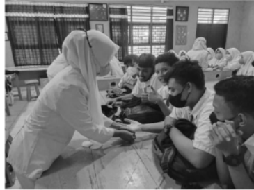
Gambar 1. Fasilitator mempraktekkan Cool, Cover, and Call dalam diskusi kelompok kecil

11 Seluruh peserta pengabdian masyarakat ini diberikan materi tentang pengertian umum luka bakar dan pertolongan pertama pada luka bakar dalam kelompok masing-masing oleh setiap fasilitator (Gambar 1).